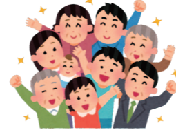
有難うございました

フェスタは、4年振りのため経験者が少なく準備は大変でしたが、理事の皆さんを始め各地区の会員の皆さんがボランティアで開催に携わって頂き無事に終了する事が出来ました。