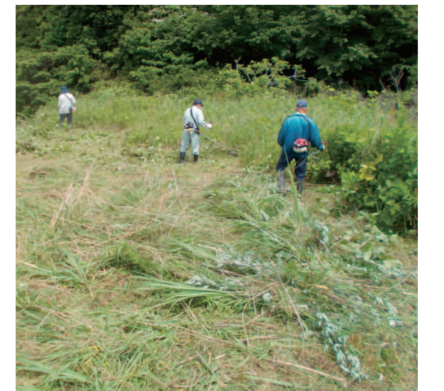
草刈職養成特別講習／実技風景