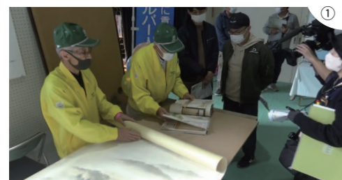
① 襖・障子・網戸の張替実演