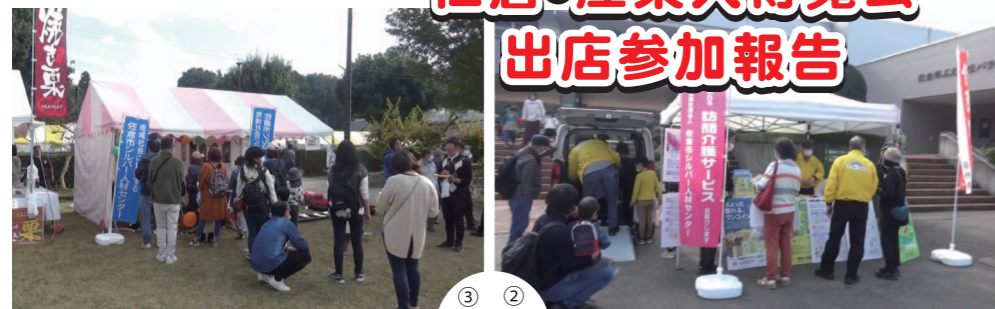
③ さまざまなお仕事の紹介