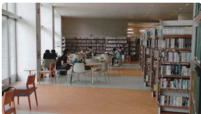
図書室(京成佐倉駅側)

実はオープン前は評判が悪かったのが気になっていたのです。京成佐倉駅側の窓側のエリアに行くとも明るく広々とした空間になっており椅子も沢山置かれていました。窓の外側には樹木や草花が植えられ庭園風になっています。元々この建物の位置が長い坂の頂上にあり、そういう素敵な設計が可能だったのです。「地下に図書館？」多くの方が暗いイメージをもっていたのです。