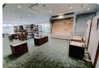
佐倉を学ぶフロア

佐倉の歴史資料(一部千葉県も)の展示と共に、相談窓口を活用し、古文書などの貴重な資料の閲覧が可能。また、歴史に関する講座や古文書等の閲覧場所として「歴史ルーム」を活用することも可能。「人権展示コーナー」「SDGsコーナー」もあります。