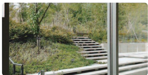
図書室の大窓の外(庭園になっている)

館内を見ても全体にゆったりとした感じと閲覧席・椅子の多さに気が付きます。閲覧席は一般コーナーが152席、絵本・児童書コーナーが40席。その他自習室に29席(学校の授業などに使える「ゆめルーム」「さくらルーム」もあります。