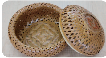
↑手の込んだ蓋つきの小物籠

市の広報で、佐倉市シルバーいきがいマイスター講座の竹工芸クラスを知ったのが出会いです。卒業までに4年を要する講座で技能や知識を学び、多くの作品を創る内に縁あって、この講座の竹工芸の講師も務めていました。しかし、2019年秋の台風災害復旧の影響で2020年度は予算が付かず、講座は終了。そこで、卒業生達と「竹工芸友の会」という同好会をつくり、毎週木曜日にレインボープラザ佐倉に集まって竹工芸を楽しんでいます。